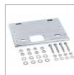
PLACA DE ADAPTACIÓN A MILORD