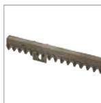
CREMALLERA NYLON 30 x 20 MOD. 4 CON ALMA DE ACERO pres. 4 piezas de 1 metro.