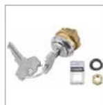
CERRADURA Cerradura de desbloqueo con llave personalizada