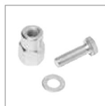
DISTANCIADORES Kit 3 distanciadores y tornillos M8x30 de fijación para soldar sobre 1 m de cremallera 2