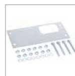
PLACA DE CIMENTACIÓN