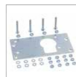
PLACA DE ADAPTACIÓN A FALCON