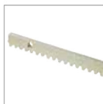
CREMALLERA 1 m de hierro zincado 30 x 12 mm 2 .