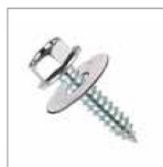
TORNILLOS Kit tornillos de fijación para atornillar sobre 1 m de cremallera - env. de 4 kit (para combinar con 6100344)