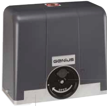
Zócalo de aluminio

Dispositivo de desbloqueo rotativo de identificación inmediata con cerradura con llave (opcional)