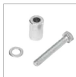
DISTANCIADORES Kit 3 distanciadores y tornillos M8x50 de fijación para soldar sobre 1 m de cremallera 2